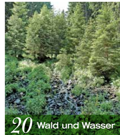
20 Wald und Wasser