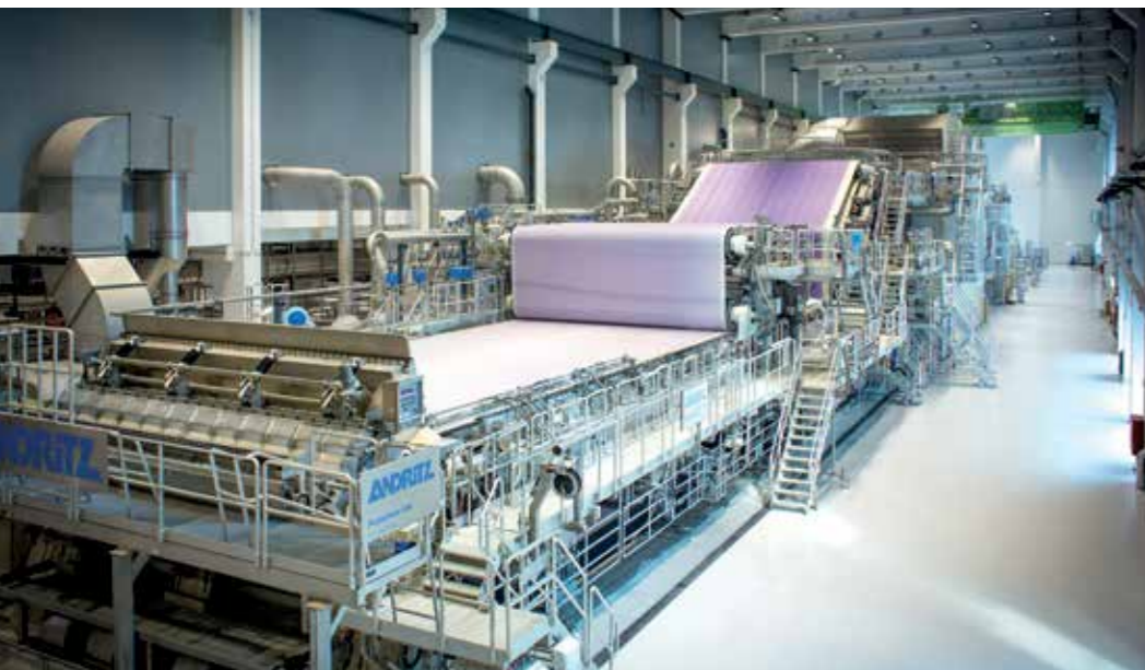
Die Maße der modernsten Papiermaschine Europas: 100 m lang, 6 m breit und 2.500 to schwer.