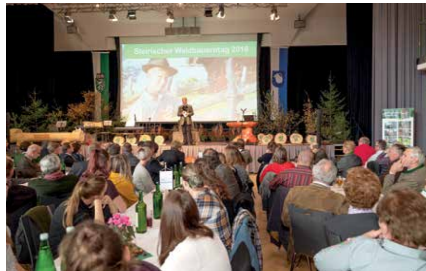
Der Waldbauerntag motiviert zum Erfahrungsaustausch, bietet Wissen, Informationen und regionale Kulinarik.