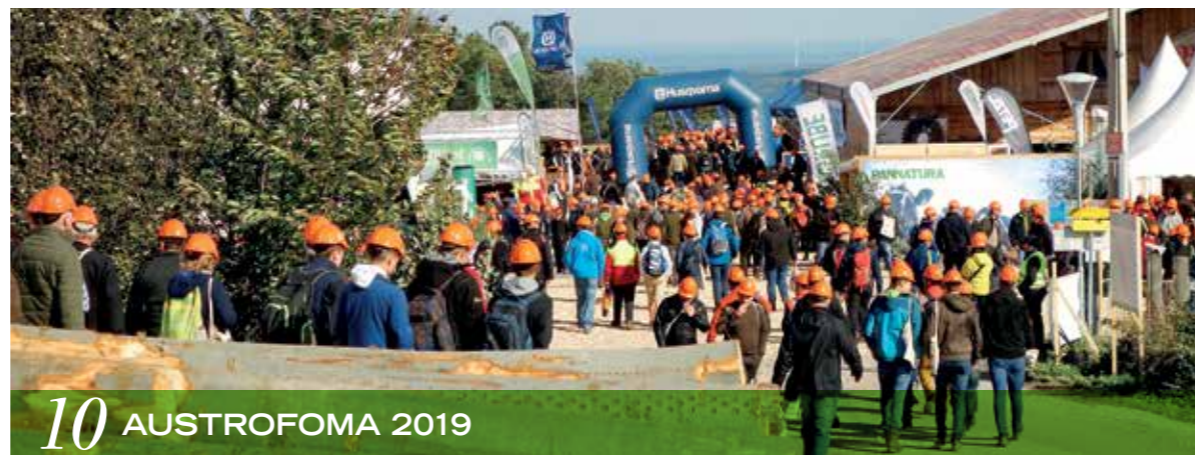
10 AUSTROFOMA 2019