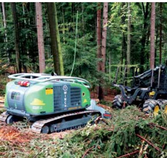
Firma ecoforst: Die Traktionswinde T-WINCH unterstützt bei der bodenschonenden Arbeit.

Erneut riesengroß war das Interesse an der alle vier Jahre stattfindenden AUSTROFOMA, die einen Querschnitt durch die moderne Technik der Waldarbeit zeigt.