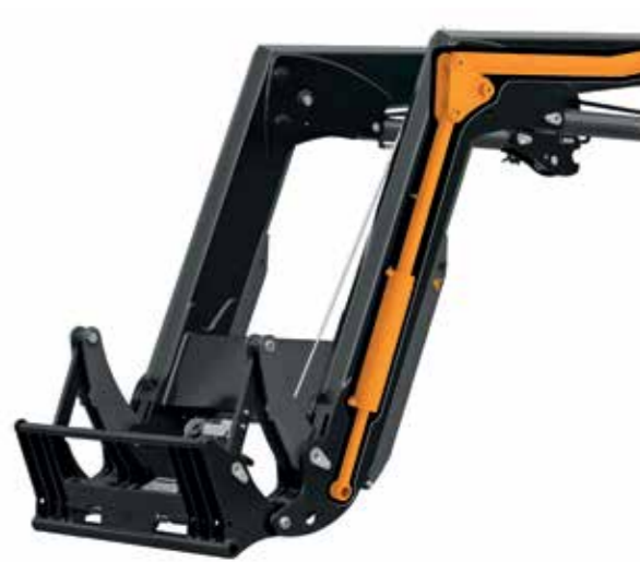
Frontladerserie XB Bionic (Fa Hauer): Mechanik und Hydraulik in Ladeschwinge integriert.