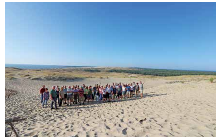
Die ausgedehnten Sanddünen auf der Kurischen Nehrung bieten ein besonderes Schauspiel.