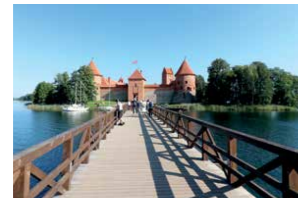
Vor der Wasserburg noch schnell ein Foto, bevor es rein geht in die Massen der Touristen.