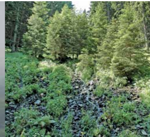
Wasser läuft meist hangparallel im Oberboden ab, sickert ins Grundwasser oder speist Quellen, Bäche und Flüsse.

Das in den Boden eindringende Wasser läuft meist hangparallel im Oberboden ab oder sickert allmählich durch und speist dann das Grundwasser sowie Quellen, Bäche und Flüsse. Viele Faktoren wie Textur, Struktur, Porosität, Skelettgehalt, Relief, Bodendecke, Wasservorrat oder Wurzelnetz beeinflussen die Versickerung des Wassers. Indem Waldböden meist eine hohe Luftkapazität und eine gute Durchlässigkeit besitzen, dringen auch stärkere Niederschläge rasch ein. Das Wasserhaltevermögen ist sehr stark von der Bodenstruktur und hier von der Porenverteilung abhängig. Schwachgründige, skelettreiche, grobporige Böden haben ein wesentlich geringeres Wasserhaltevermögen als tiefgründige Böden mit vielen