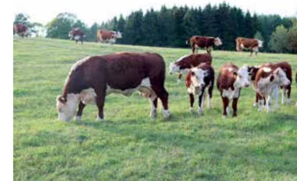
In Estland trafen wir einen Landwirt, welcher sich mit der Zucht von Hereford Rindern beschäftigt.