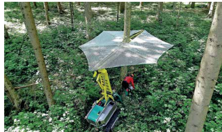
Das Pflanzel-Personen-Schutzdach wird auf der Forstraupe Moritz montiert und bietet der bedienenden Person Schutz vor herabfallenden Ästen und Zweigen.