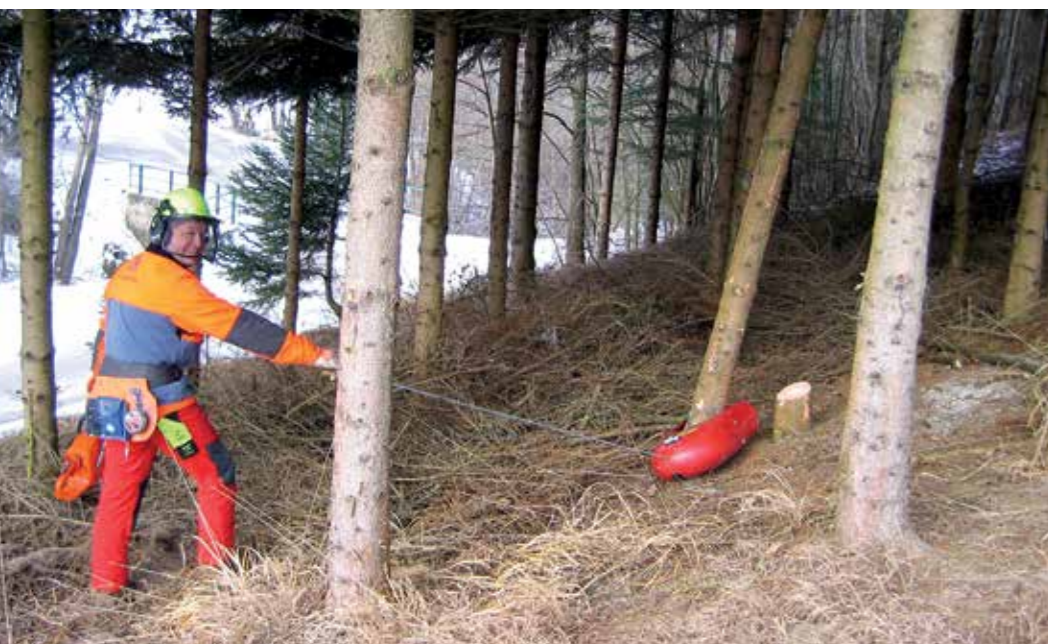
Ein Fällboy erleichtert das Umziehen von Schwachholz.