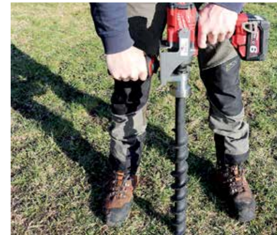
Durch die robuste Lagerung im DrillFast von BaSt-Ing wirken keine Quer- oder Längskräfte auf den Schlagschrauber.

Abgesehen von den Einreichungen gab es noch weitere Highlights und Innovationen auf der AUSTROFOMA 2019 zu entdecken. Informationen zu allen Ausstellern sowie detaillierte Beschreibungen der ausgestellten Produkte finden Sie im aktuellen AUSTROFOMA Katalog. Restexemplare erhalten Sie in der Forstabteilung der LK Niederösterreich unter forst@lk-noe.at.