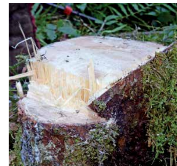
Schnittbild am Stock eines Fällheberschnitts.