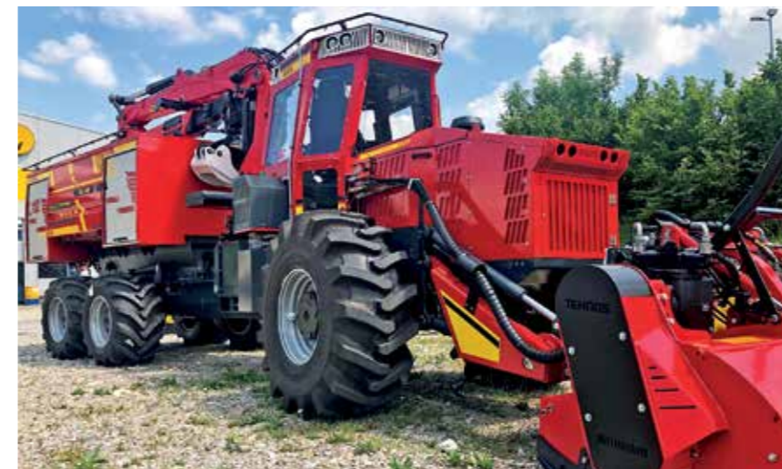
Der Multi-Fire-Truck (MFT) der slowenischen Maschinenbauer Bijol d.o.o. ist ein geländegängiges, belastbares Löschfahrzeug in modularer Bauweise auf Basis eines Forwarders.