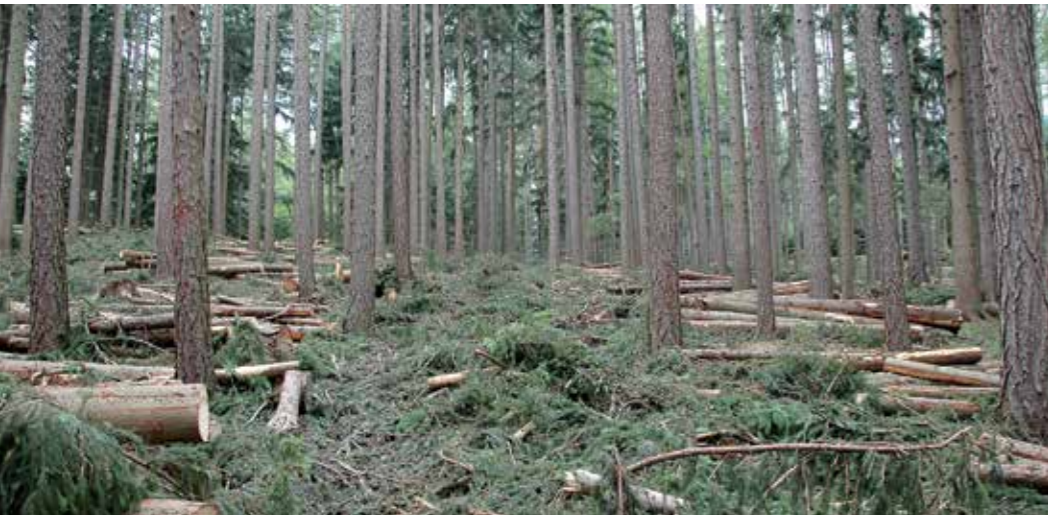
Eine fachgerechte Durchforstung sorgt für stabile Bestände in der Zukunft.