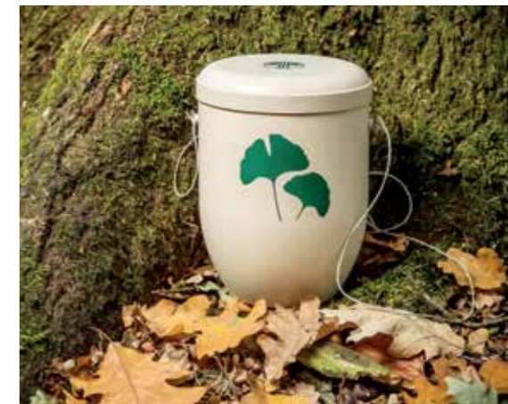
ARBOFORM® besteht zu 100 % aus nachwachsenden Rohstoffen.