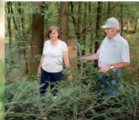
Ein Bild ohne viel Erklärungsbedarf - die Unterschiede sprechen für sich. Die Freude über die Entwicklung der Tannennaturverjüngungen ist besonders groß.

Moostepichen und dient daher als Vorbereitung für das Schaffen von Keimvoraussetzungen für die verschiedensten Baumsamen.