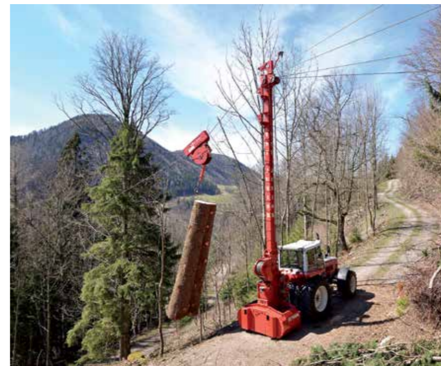
Das modular aufgebaute Seilgerät TST Junior von Tröstl ist ein kostengünstiges, leichtes (2 to, 500 m) 3-Seilgerät für den Traktor-Dreipunktbau, kann stufenweise erweitert werden.