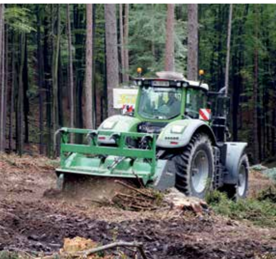
Mulchen von Schlagabraum und Baumstücken - der Forstmulcher von Steinwendner im Einsatz.

Herzstück waren wieder einmal der rund 5 km lange Wald-Rundkurs inkl. Waldhackguterzeugung und