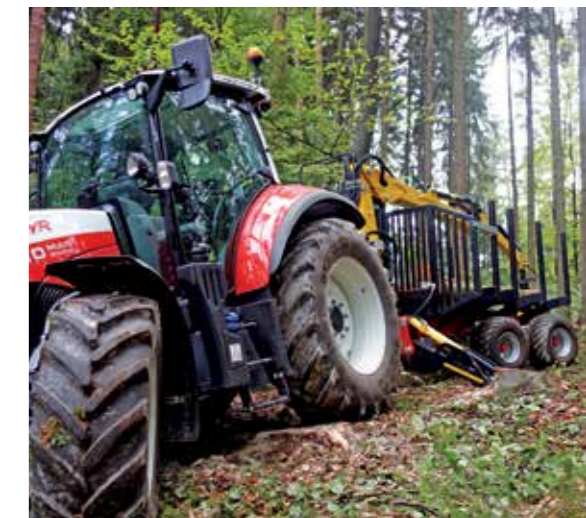
Traktor-Kranwagen-Kombination: Der neue Moser Krananhänger mit Lenkachse aus Altmünster.

Maschineneinsatz. Vor allem Seilwinden, Krananhänger und Seilgeräte sind dabei in Verwendung. Der verstärkte Einsatz moderner Technik bringt nicht nur eine höhere Arbeitsleistung sondern auch sicherheitstechnische Vorteile mit sich. Ein wesentliches Motiv, warum die AUSTROFOMA auch für Kleinwaldbesitzerinnen und Kleinwaldbesitzer von großem Interesse war.