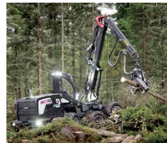
Hybridtechnologie vom Feinsten zeigt MHD mit dem neuen Harvester Logset H8 Hybrid. Höhere Effizienz bei geringem Kraftstoffverbrauch und CO 2 -Ausstoß.