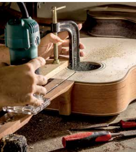
Es gibt viele verschiedene Hölzer und Holzwerkstoffe, die im Musikinstrumentenbau zum Einsatz kommen.

Was haben Schweizer Taschenmesser und Holz gemeinsam? Nichts? Weit gefehlt. Zwei bestechende Eigenschaften: Einfache Handhabung bzw. Bearbeitung kombiniert mit äußerst vielseitigen Einsatzmöglichkeiten, vom Messer bis zum USB-Speicherstick und vom einfachen Holzbrett bis zu hochtechnologischen Holz- und Verbundwerkstoffen.