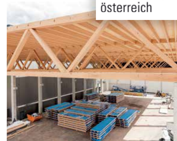
Lagerhallenüberdachung aus Buchen-Furnierschichtholz der Firma Pollmeier.

Holz lässt sich nach seiner Nutzung als dauerhaftes Produkt erneut stofflich nutzen. Papier-, Faser- und Zellstoffherzeugung liefern z.B. Fasern für Textilien. Bei der Produktion entstehen Nebenprodukte wie z.B. der Aromastoff Vanillin sowie Essigsäure für Essiggurken und Holzzucker (Xylose) für die Kaugummiproduktion. Das bei der Viskoseherstellung als Nebenprodukt anfallende Natriumsulfat findet in der Reinigungsmittelindustrie reißenden Absatz und sogar im Lippenstift und Nagellack steckt "Holz" in Form von Zellulose bzw. Lignin.