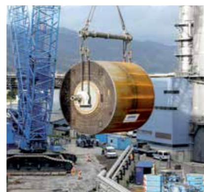
Ein 1.200 to Spezialkran hebt den Trockenzyylinder in die Maschinenhalle.

Mio. €) in Betrieb genommen. Die beiden Kraftpapiermaschinen sind aktuell die Modernsten weltweit. Diese Investitionen tragen wesentlich zur Absicherung des Standortes bei. Das Herzstück der PM3 ist der für die Trocknung des Papiers zuständige und weltweit größte geschweißte Glätt-Trockenzylinder.