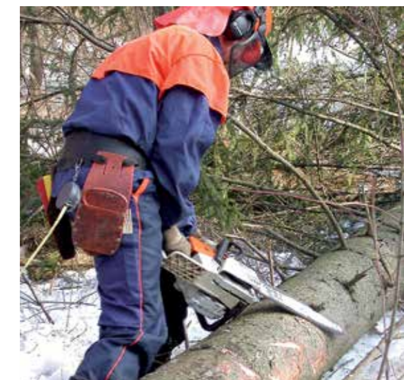
Das Gewicht der Säge liegt am Stamm.