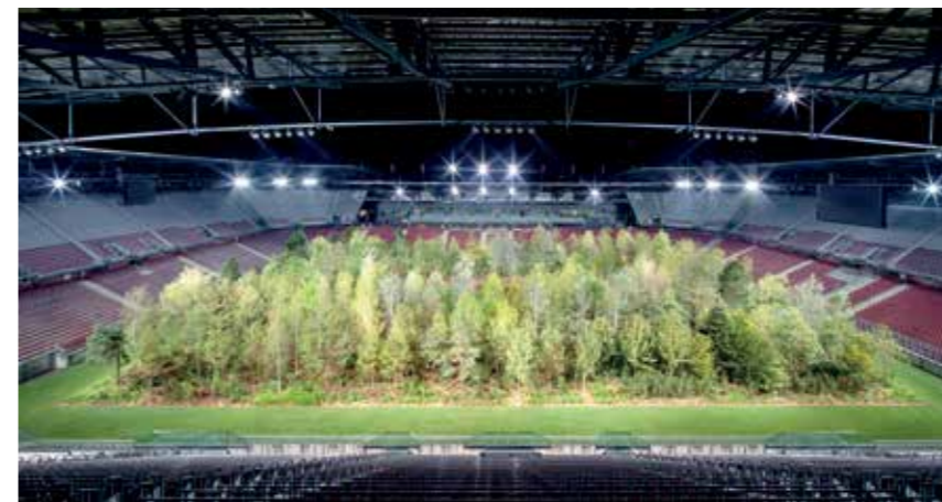
FOR FOREST - Die ungebrochene Anziehungskraft der Natur.