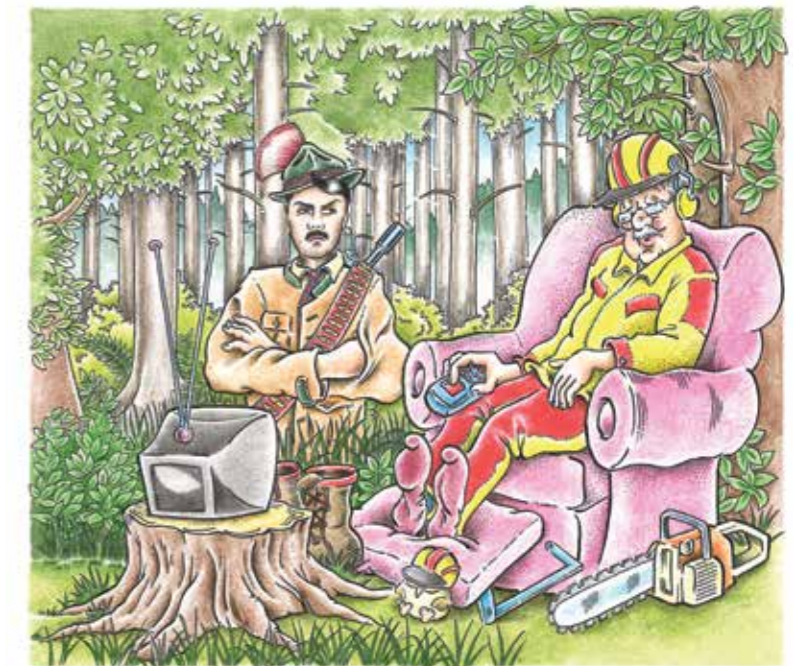
KURZE PAUSE? - VERGISS ES, SIE FINDEN DICH ÜBERALL... (NÄHERES ZUM THEMA „RICHTIGE PAUSEGESTALTUNG“ IM BEITRAG AUF DEN SEITEN 14 UND 15).