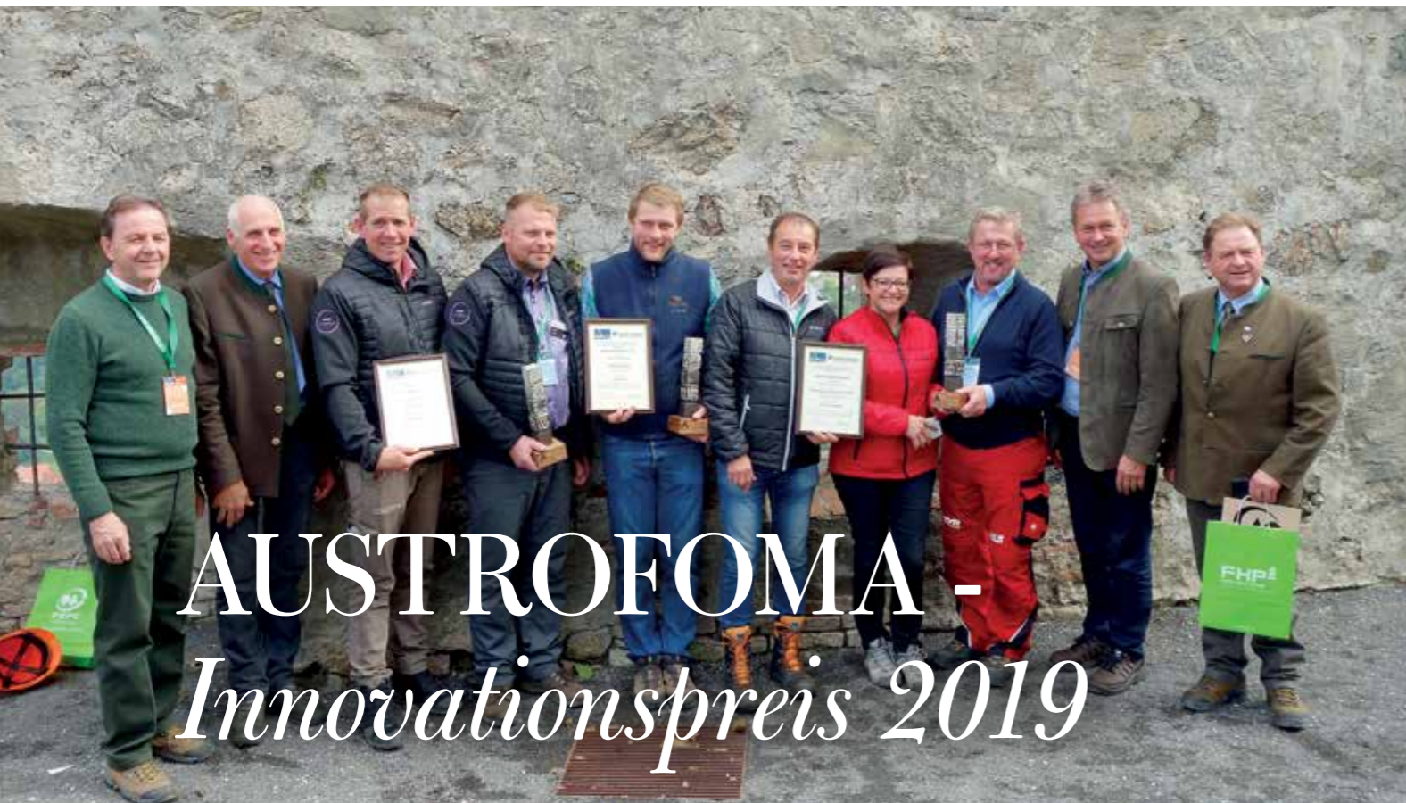
Innovationspreisträger 2019 bei der feierlichen Auszeichnung mit Vertretern der heimischen Forstwirtschaft.