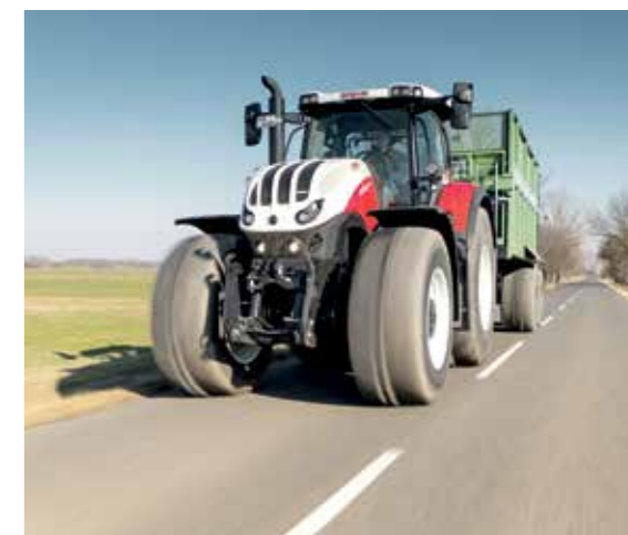
Steyr S-Brake soll das "Einknicken" des Gespanns bei Verzögerung über Motor und Getriebe verhindern.