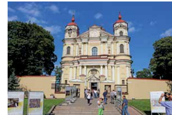
Bereits in Vilnius bestaunten wir die ersten wunderschön renovierten, historischen Gebäude.

In der Wasserburg von Trakai erleben die Reisenden die Auswirkungen des Tourismus mit voller Wucht. Wenn sich Besucher gegenseitig auf die Zehen steigen, wenn Führer versuchen Kollegen mit noch lauterem Geschrei zu übertönen, dann macht der Besuch der schönsten historischen Stätte keinen Spaß mehr. Tallinn wird ebenso wie viele andere Städte in Europa mit Kreuzfahrtschiffen sprichwörtlich heimgesucht und die aus den Schiffen strömenden Urlauber überschwemmen die Innenstadt. Der Reiseleiter des Waldverbands Steiermark, selbst Teil des Systems und daher natürlich auch mitverantwortlich für diese Auswirkungen, fragt sich selbstkritisch: „Wohin wird uns diese Entwicklung wohl bringen?“