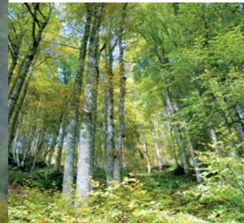
Der Wasserhaushalt in Waldbeständen hängt von zahlreichen Faktoren wie z.B. Baumarten, Bodenverhältnissen, geologischen Gegebenheiten und klimatischen Einflüssen ab.

Klein- und Mittelporen. Die Wasserkapazität des Waldbodens hängt aber auch davon ab, wie weit vorher durch Verdunstung die Aufnahmefähigkeit erhöht wurde. Nach einer längeren niederschlagsfreien Zeit kann der Waldboden 80 - 250 mm Niederschlag aufnehmen. Dadurch kann der Wald ein längerdauerndes starkes Niederschlagsereignis durchaus speichern, was vor allem für den Hochwasserschutz von größter Bedeutung ist