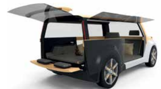
„WoodC.A.R.“ - Zeitalter Bioökonomie: Holz trifft Fahrzeugtechnologie - Holz ist ein Leichtbaumaterial mit hervorragenden Festigkeits- und Steifigkeitswerten sowie einem exzellenten Dämpfungsverhalten.