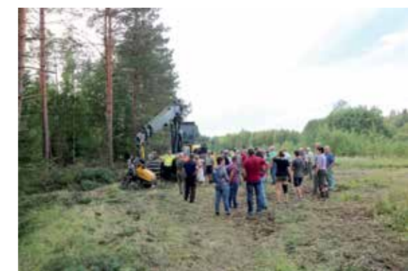
Der Austausch mit Forstexperten stand selbstverständlich auch am Programm.