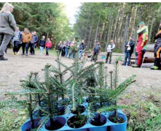
Die Bewusstseinsbildung über die Notwendigkeit der Bewirtschaftung unserer Wälder ist wichtiger denn je.