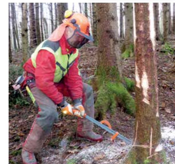
Arbeit mit geradem Rücken und Kraft aus den Beinen.

Selbstverständlich muss auf mögliche Witterungseinflüsse geachtet werden. Ein Bauwagen oder eine Hütte schützen nicht nur vor Regen, sondern bieten im Winter auch die Gelegenheit, sich aufzuwärmen oder sich bei der Mittagspause auf einer Bank auszustrecken und den Körper zu entlasten. Im bäuerlichen Bereich kann man zum Glück verschiedene Arbeitsvorgänge variieren. Nach getaner morgendlicher Stallarbeit gehts z.B. für drei bis vier Stunden in den Wald. Im Optimalfall kann man zuhause Mittagessen und am Nachmittag gestärkt weiterarbeiten. Durch die Abwechslung bleibt man konzentrierter und vermeidet Arbeitsunfälle.