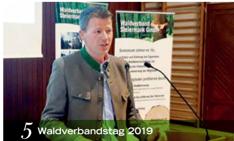
5 Waldverbandstag 2019