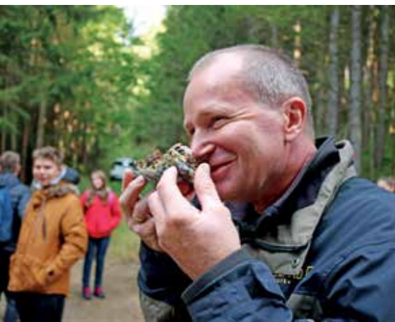
Wald zu Wald Wanderungen bieten den Menschen die Möglichkeit, in den Duft des Waldes einzutauchen.