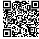
Lagerplatz Nadelwertholz Vbg

☐ Angebots- und Besichtigungszeit vom 25. November bis 12. Dezember am Lagerplatz