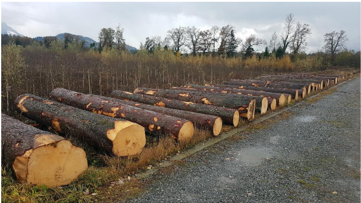
Bild: Submissionsplatz in Altenstadt 2017

Besichtigungs- und Angebotszeitraum 25. 11. bis 12. 12. 2017