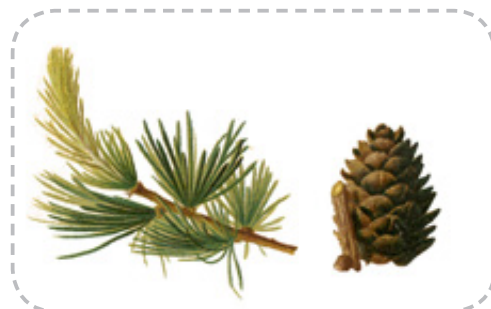
Lärchen-Zweig (links im Bild)