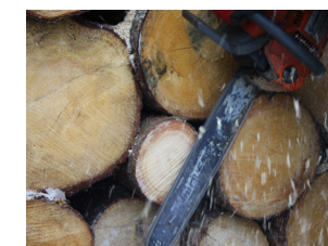
Links: Stirnseite nach Öffnung des Folienlagers Rechts: Stirnseite eines Stammes nach Anschnitt