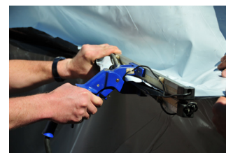
Verschweissen der Ecken mit der Schweißzange.